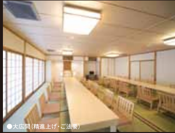
●大広間(精進上げ・ご法要)