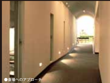
●斎場へのアプローチ