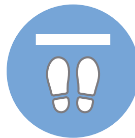
ソーシャル ディスタンス